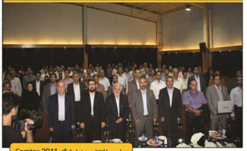
مراسم افتتاحیه نمایشگاه Comtex 2011