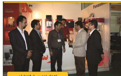
اهدای تندیس غرفه داران

دانا از کلیه افرادی که به نوعی این شرکت را در طراحی و اجرای این رویداد همراهی و همفکری نمودند صمیمانه سپاسگذار است. در این راستا علاقه داریم تا با ذکر نام از دوستان COMTEX 2011 ابراز تشکر نمائیم. حقیقتاً اینگونه ابراز تشکر دارای ریسک فراموشی نام برخی عزیزان است لذا پیشاپیش از کلیه حامیان از قلم افتاده صمیمانه عذر خواسته و تقاضای عفو و نگرش اغمازی داریم: