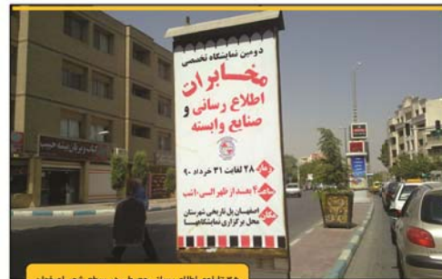
۳۵ تابلوی اطلاع رسانی محیطی در سطح شهر اصفهان

رویداد کامتکس با مدت زمان اندک در دست جهت انجام امور تبلیغاتی، فرآیند اطلاع رسانی به مردم و متخصصین را در طبقه بندی ذیل به انجام رسانید: