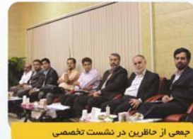
جمعی از حاضرین در نشست تخصصی

ایشان بیان داشتند ایجاد امنیت در فضای سایبر بدون شک مستلزم همکاری تنگاتنگ کلیه فعالان و دست اندرکاران در حوزه فضای تولید و تبادل اطلاعات می باشد که به طور قطع در صورت عدم هماهنگی در بین سازمان های ذیربط و شرکت های ارائه کننده سرویس های اینترنتی و غیره امنیت در این حوزه مختل و دچار اشکال خواهد شد.