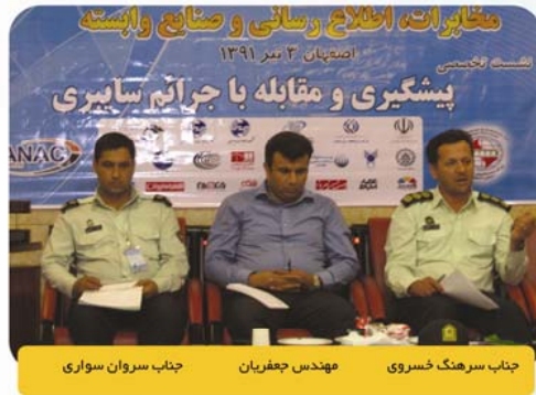
جناب سرهنگ خسروی، مهندس جعفریان، جناب سروان سواری

این نشست با حضور مدیران شرکت های ارائه دهنده سرویس های اینترنتی ISP و ISDP و مسئولین پلیس سایبری استان اصفهان آخرین روز برای نمایشگاه در ساعت ۱۷:۳۰ دقیقه برگزار گردید. در این گردهمایی جناب سرهنگ «ستار خسروی» رئیس پلیس فضای تولید و تبادل اطلاعات استان اصفهان که به منظور پیش بینی پیشگیری و کشف جرائم سایبری و مخابراتی و همچنین گسترش سطح تعاملات فعالان و دست اندرکاران در این عرصه برگزار شده بود، اظهار داشت: تامین و حفظ امنیت فضای سایبری از وظایف ذاتی پلیس فضای تولید و تبادل اطلاعات است اما با توجه به پیچیدگی و گستردگی کار در این حوزه همکاری و همذلی سایر فعالان این حوزه در تحقق اهداف پلیس بی تاثیر نیست. وی افزود: امنیت در فضای سایبر بدون شک مستلزم همکاری تنگاتنگ کلیه فعالان و