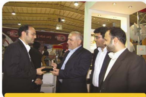
مراسم اهدا، تندیس غرفه داران

شرکت آرمان پژوهان داتا از کلیه عزیزانی که این مجموعه را در طراحی و اجرای این رویداد بزرگ علمی مخابراتی همراهی نمودند صمیمانه سپاسگذاری می نماید. در این راستا علاقه داریم تا با ذکر نام از همراهان COMTEX2012 قدردانی نماییم. پیشاپیش از کلیه حامیان از قلم افتاده صمیمانه عذر خواهی می نماییم.