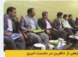
جمعی از حاضرین در نشست خبری

در این بین که ساعت ۱۹:۳۰ دقیقه ۳۱ خرداد ماه آغاز گردید: جناب آقای مهندس حکیم جوادی معاون وزیر ارتباطات، جناب آقای مهندس کشای قائم مقام مخابرات استان اصفهان، جناب آقای مهندس عابدی مدیرکل دفتر فناوری اطلاعات استانداری اصفهان، جناب آقای مهندس شفیعی مدیرکل فناوری استان و مدیرکل اداره کل تنظیم مقررات و ارتباطات رادیویی استان،