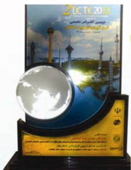
تندیس سومین کنفرانس LTCG