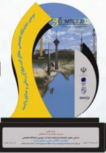
تندیس یاد بود نمایشگاه