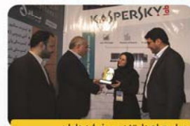
مراسم اهدا، تندیس غرفه داران