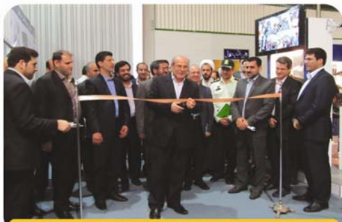
مراسم افتتاحیه COMTEX 2012

سومین دوره نمایشگاه مخابرات اصفهان ( COMTEX 2012 ) تحت عنوان یکی از بزرگترین رویدادهای مخابراتی کشور در بین اصحاب رسانه معرفی گردید و این اقبال را داشت تا میزبان ۴۱ شرکت بزرگ مخابراتی از سراسر کشور عزیزمان ایران باشد. به استناد گزارش بخش آمار شرکت نمایشگاه ها بیش از ۱۰۰۰۰ نفر در طی چهار روز برگزاری نمایشگاه مخابرات از این رویداد بازدید به عمل آوردند؛ همچنین تعداد استان های که از نمایشگاه بازدید نمودند، ۲۵ استان گزارش گردید. این آمار نسبت به سال گذشته تقریباً ۲۴ درصد افزایش داشته است.